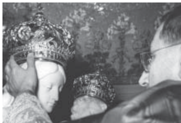
Il Cardinale Siri incorona la "Guardia Vaticana"

ritrovato felicemente d'accordo. Allora, dobbiamo cominciare a prepararci?