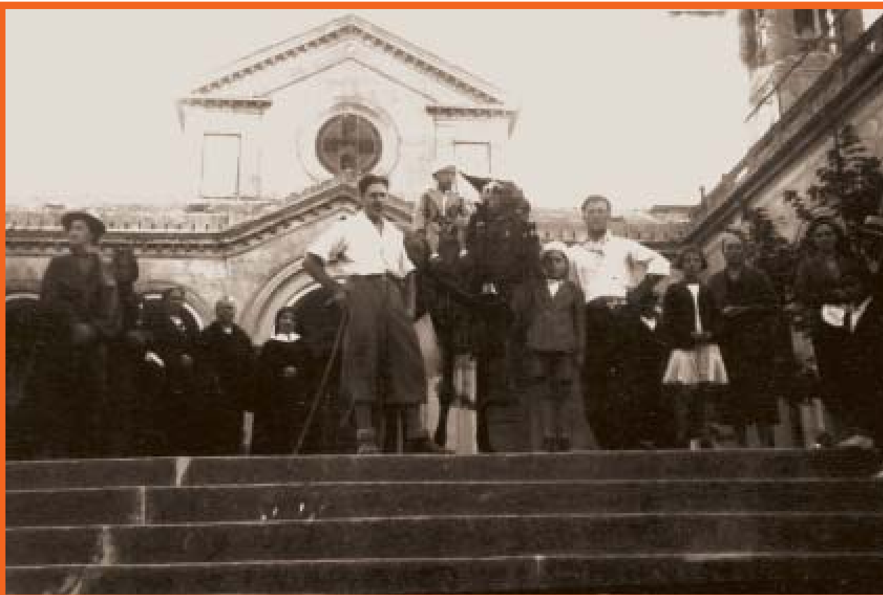
Anno 1938 . Scaricate le provviste per il santuario, una posa doverosa.