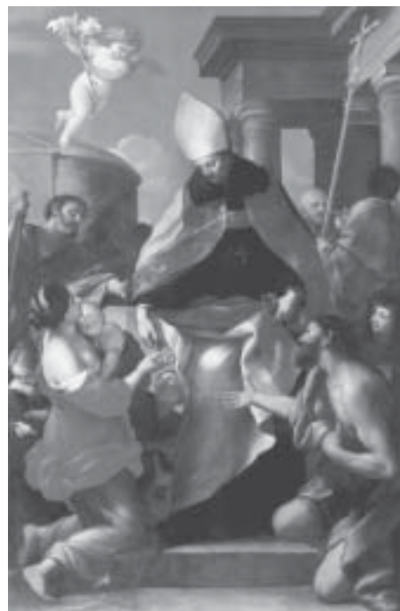
Elemosina di S. Tommaso (Giovan Francesco Romanelli) Chiesa di S. Agostino in Campo Marzio - ROMA