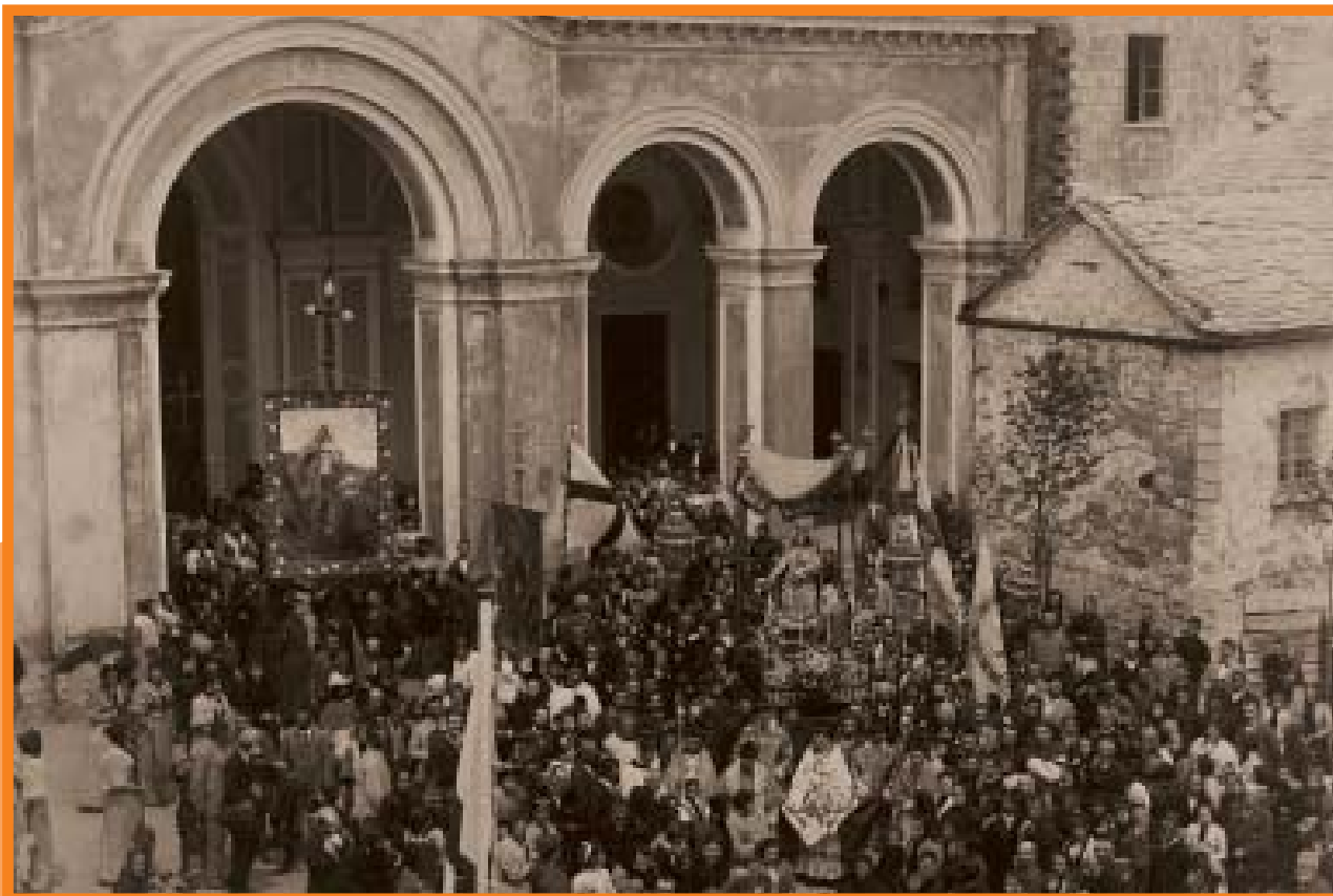
Anno 1896! Parte la processione...